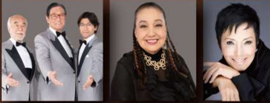
ボニー・ジャックス 湯川れい子 池畑慎之介 (ピーター)